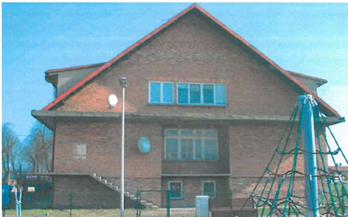
Rysunek 4 Lokalizacja inwestycji – elewacja południowo-zachodnia