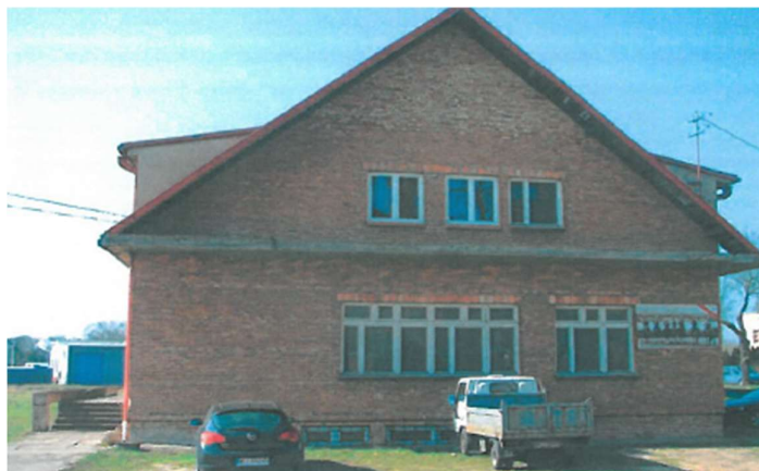
Rysunek 2 Lokalizacja inwestycji – elewacja północno-wschodnia

Wentylacja pomieszczeń realizowana jest poprzez wentylację grawitacyjną – świeże powietrze jest dostarczane do wnętrza budynku przez nieszczelności i rozszczelnienia okien i drzwi.