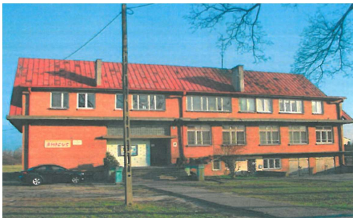
Rysunek 5 Lokalizacja inwestycji – elewacja północno-zachodnia