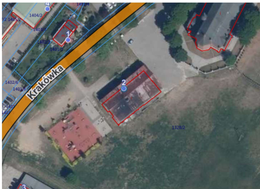
Rysunek 1 Lokalizacja inwestycji – teren budynku przy ul. Krakówka 2 w Płocku

Budynek parafialny Parafii Rzymsko-Katolickiej p.w. św. Benedykta w Płocku znajduje się przy ul. Krakówka 2 w Płocku (województwo mazowieckie, powiat płocki, gmina Płock, 09-401 Płock) na działce ewidencyjnej nr 1382/2 z obrębu Radziewie (identyfikator działki 146201_1.0012.1328/2). Lokalizacja budynku i teren działki został pokazany na rysunku poniżej.