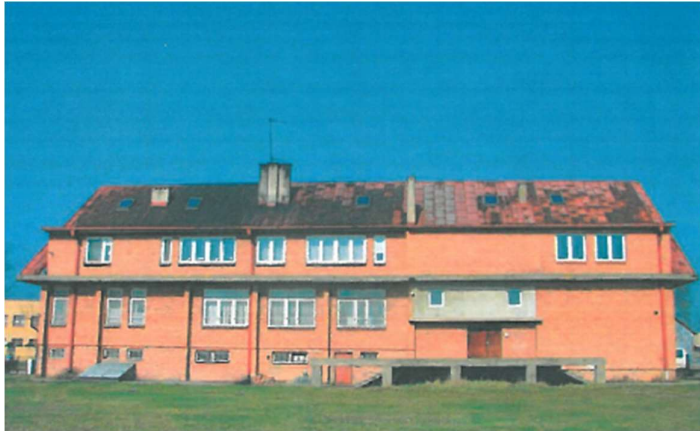
Rysunek 3 Lokalizacja inwestycji – elewacja południowo-wschodnia